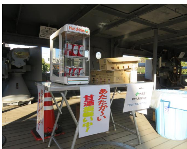
安全に配慮し缶入り甘酒を進呈