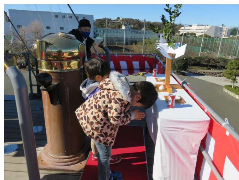
早くコロナが収束しますように！ ついでにお小遣いアップ、よろしく