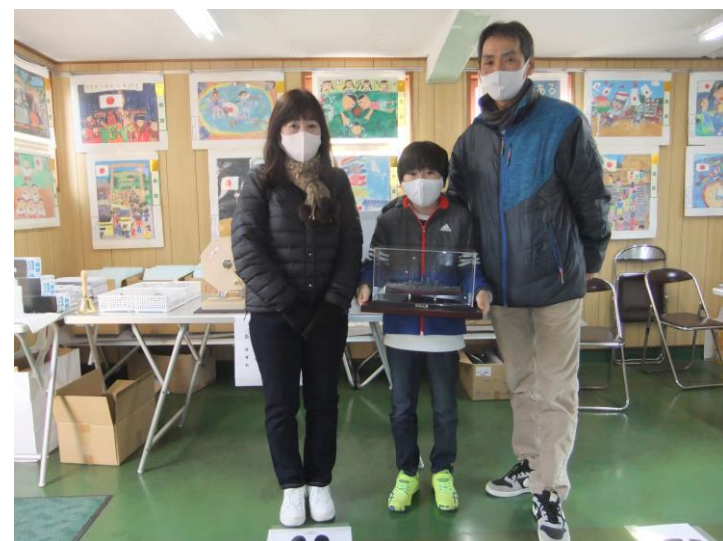
見事！1等当選しました。