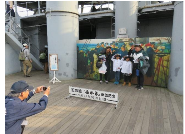
艦内ではスタンプラリー、ハンモック体験、軍服撮影を楽しんでいただきました