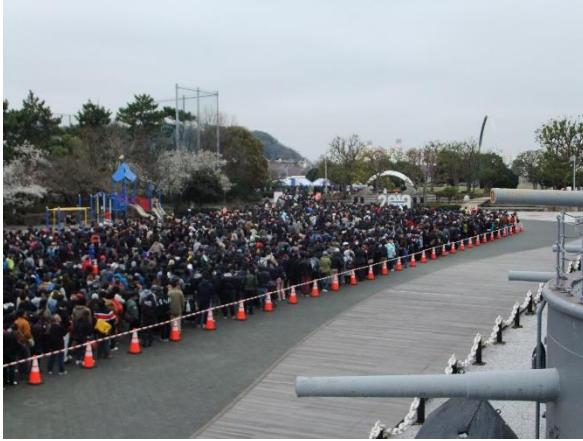
米軍基地への入場を待つ長蛇の列

天候にも恵まれ、3万人以上の方が米軍基地内での桜とステーキやピザ喫食やイージス艦の見学を楽しまれました。また、三笠には約2500名の方々が来艦されました。