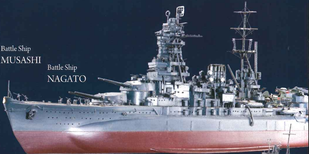
Battle Ship NAGATO