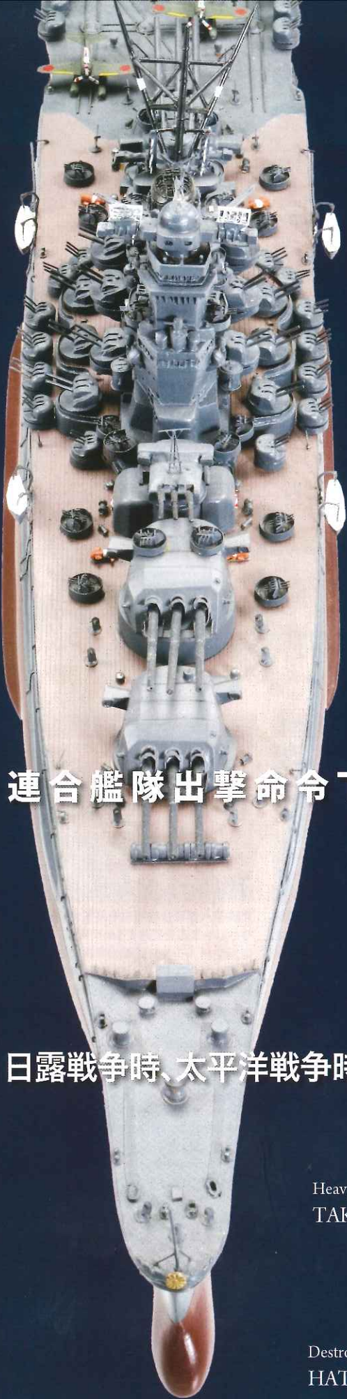
Battle Ship MUSASHI