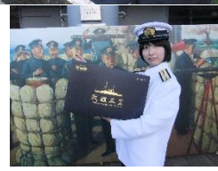
甘酒で温まって、スタンプラリーで景品をget！