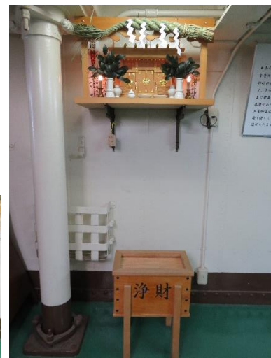
最上艦橋と三笠神社で強力なパワーをもらいました！