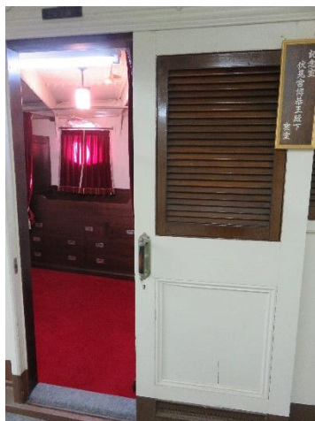
艦橋操舵室、伏見宮殿下私室の特別公開