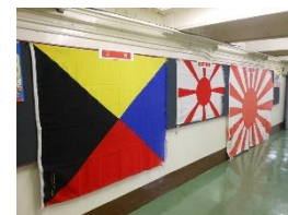
VR、写真撮影も賑わいました！