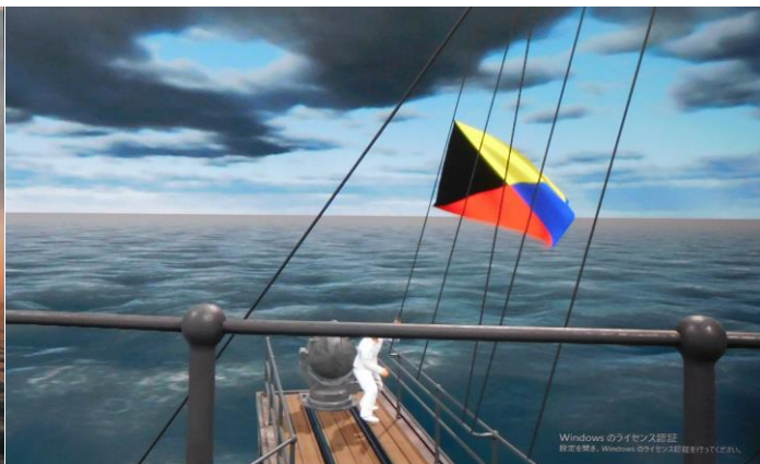
掲揚中の Z 旗