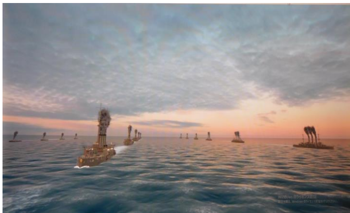
三笠に続航する聯合艦隊各艦