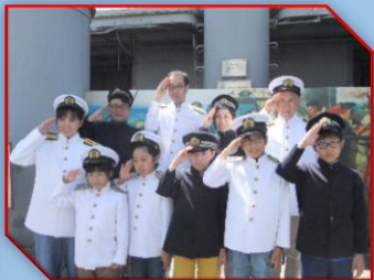
軍服着て記念写真