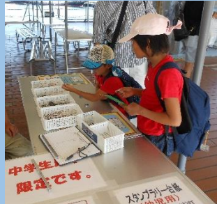
スタンプラリーで缶バッジゲット!