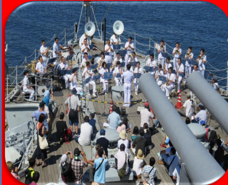
海上自衛隊横須賀音楽隊演奏会 8.4(日) 13:30~(荒天中止) 記念艦「三笠」 前甲板にて行います

記念艦「三笠」で掲揚した軍艦旗、Z旗、大将旗を贈呈! 来艦して申込まれた方に抽選で一枚!